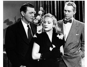
1945 SENORITA FROM THE WEST de Frank R. Strayer avec Allan Jones, Jess Barker