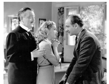
1940 UN MARI IMAGINAIRE (Third finger, left hand) de Robert Z. Leonard avec R. Walburn, M. Douglas