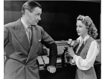
1944 JE PRÉFÈRE LES BRUNES (Andy Hardy's blonde trouble) de G. Seitz avec H. Marshall