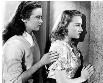
1944 YOUTH RUNS WILD de Mark Robson avec Vanessa Brown