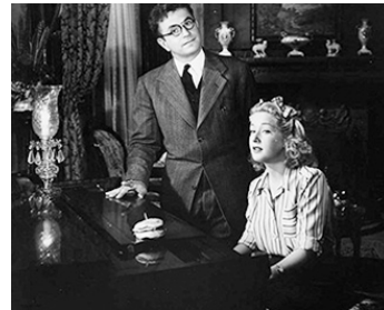
1945 THE BEAUTIFUL CHEAT de Charles Barton avec Noah Beery Jr