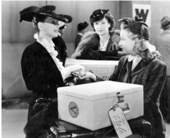
1942 UNE FEMME CHERCHE SON DESTIN (Now, Voyager) d'I. Rapper avec Bette Davis