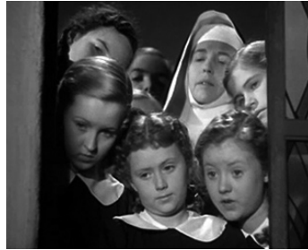
1936 LE JARDIN D'ALLAH (The Garden of Allah) de Richard Boleslavsky avec Marcia Mae Jones