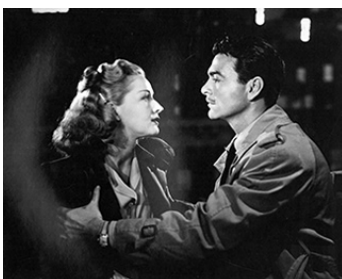
1946 LE COUPABLE (The Guilty) de John Reinhardt avec Don Castle