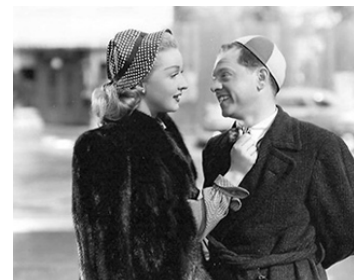
1946 PEINES DE CŒUR (Love laughs at Andy Hardy) de W. Goldbeck avec Mickey Rooney