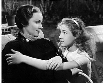
1937 UNE JOURNÉE DE PRINTEMPS (Call it a day) d'Archie Mayo avec Frieda Inescort