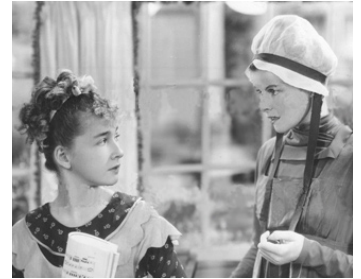
1937 POUR UN BAISER (Quality Street) de George Stevens avec Katharine Hepburn