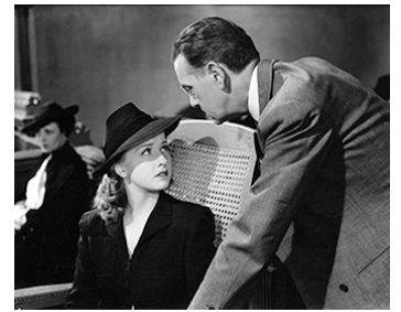
1941 THE PEOPLE VERSUS DR KILDARE d'Harold S. Bucquet avec Paul Stanton