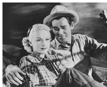
1948 LES RÉVOLTÉS DU TEXAS (Strike it rich) de Lesley Selander avec Rod Cameron