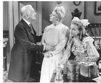
1940 THE WILD MAN OF BORNEO de Robert B. Sinclair avec Frank Morgan, Connie Gilchrist