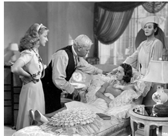
1938 UNE ENFANT TERRIBLE (Hard to get) de Ray Enright avec Ch. Winninger, Olivia de Havilland