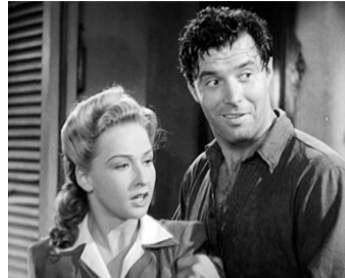
1942 FORÇATS CONTRE ESPIONS (Seven Miles from Alcatraz) d'E. Dmytryk avec James Craig