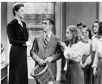
1940 FORTY LITTLE MOTHERS de Busby Berkeley avec Judith Anderson, Eddie Cantor