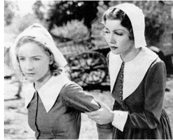
1936 LE DÉMON SUR LA VILLE (Maid of Salem) de Frank Lloyd avec Claudette Colbert