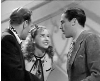
1937 L'AVENTURE DE MINUIT (It's love I'm after) d'A. Mayo avec L. Howard, Patric Knowles