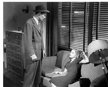
1946 FATALITÉ (Suspense) de Frank Tuttle avec Barry Sullivan