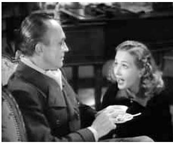
1940 ÉVASION (Escape) de Mervyn LeRoy avec Conrad Veidt