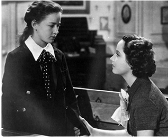
1936 ILS ÉTAIENT TROIS (These three) de William Wyler avec Merle Oberon