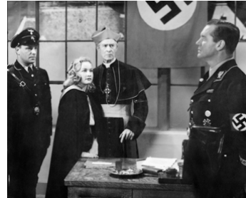
1942 LES ENFANTS D'HITLER (Hitler's Children) d'Edward Dmytryk avec H. B. Warner