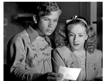
1939 L'ESCALIER SECRET (Nancy Drew & the hidden staircase) de W. Clemens avec Frankie Thomas