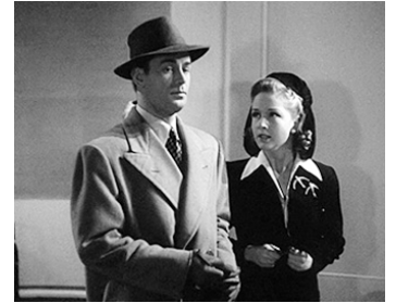
1942 LA CLÉ DE VERRE (The Glass Key) de Stuart Heisler avec Alan Ladd