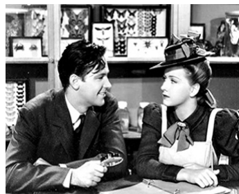
1940 THOSE WERE THE DAYS de Theodore Reed avec William Holden