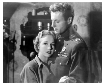
1949 TRAHISON À BUDAPEST (Guilty of Treason) de Felix E. Feist avec Richard Derr