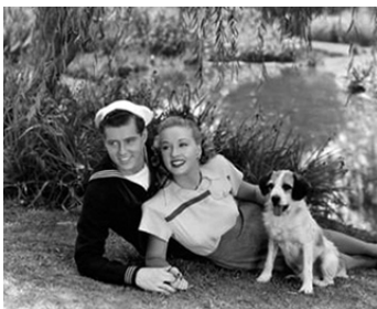
1945 BREAKFAST IN HOLLYWOOD d'Harold Schuster avec Edward Ryan