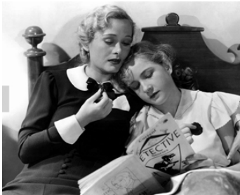
1938 L'ENFANT REBELLE (Beloved Brat) d'Arthur Lubin avec Dolores Costello