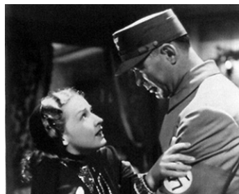
1940 LA TEMPÊTE QUI TUE (The Mortal Storm) de Frank Borzage avec Ward Bond