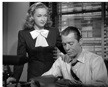
1946 DÉTECTEUR DE MENSONGE (The Truth about murder) de Lew Landers avec Morgan Conway