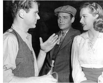
1942 LA FIÈVRE DU JAZZ (Syncopation) de William Dieterle avec Jackie Cooper, Ted North