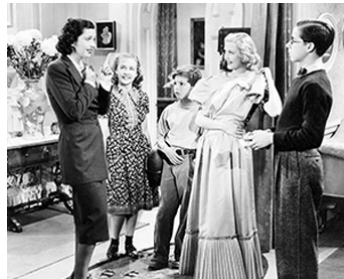
1938 CHÉRIE (My Bill) de John Farrow avec Kay Francis, Anita Louise, Bobby Jordan