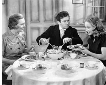
1937 LA FEMME ERRANTE (White Banners) d'E. Goulding avec Kay Johnson, Claude Rains