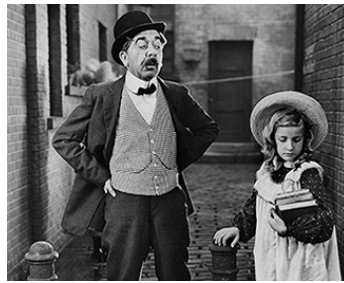
1933 CAVALCADE (Cavalcade) de Frank Lloyd avec Herbert Mundin