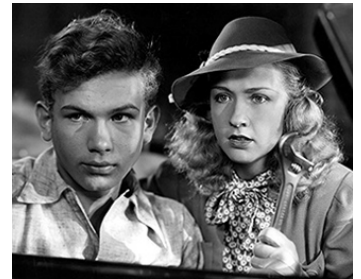
1938 NANCY DÉTECTIVE (Nancy Drew detective) de William Clemens avec Frankie Thomas