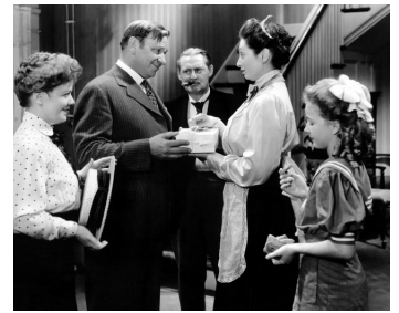
1935 IMPÉTUEUSE JEUNESSE (Ah, wilderness) de C. Brown avec W. Beery, Lionel Barrymore