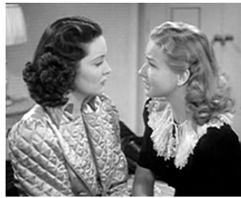
1940 GALLANT SONS de George B. Seitz avec Gail Patrick