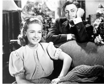
1941 SOUVENIRS (H.M. Pulham, Esq.) de King Vidor avec Robert Young