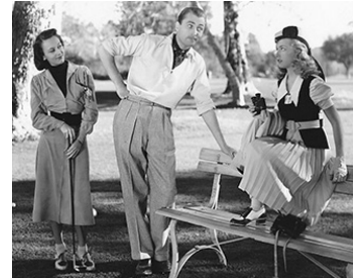
1938 MADAME ET SON CLOCHARD (Merrily we live) de N. McLeod avec Ann Dvorak, B. Aherne