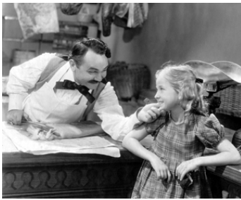
1932 LE VALET D'ARGENT (Silver Dollar) d'Alfred E. Green avec Edward G. Robinson